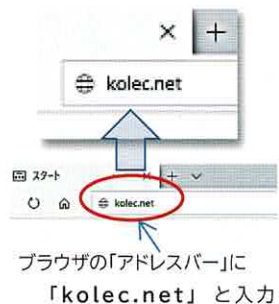
ブラウザの「アドレスバー」に「kolec.net」と入力

オリジナル教材や、「NHK for School」の番組紹介、出前講座の講師の方々から提供いただいた動画の配信などを行います。 そのほか出前講座のメニュー、申込書やアンケート用紙のダウンロードも可能。あらゆる情報を随時更新していく予定です。