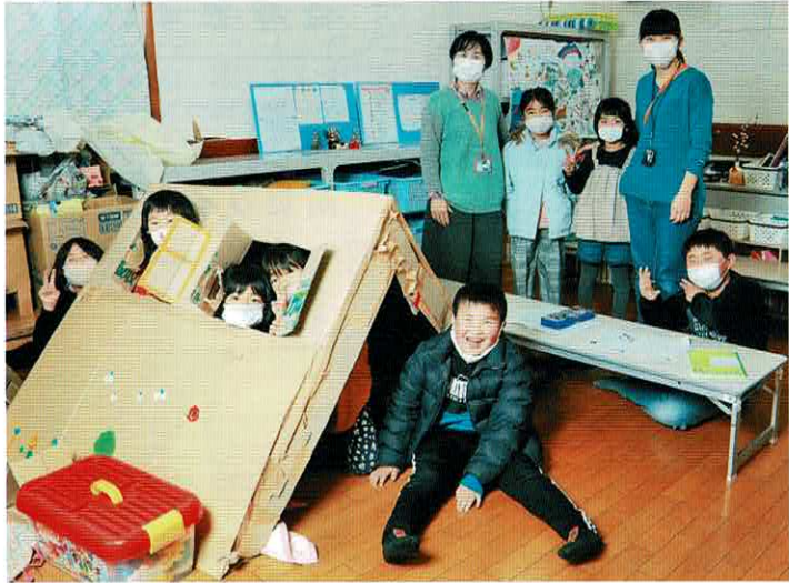
「ダンボールハウス」は常設!?しています！

若杉児童クラブは子ども達の笑顔がはじける少人数のアットホームな児童クラブです。 保育園からずっと同じお友達と過ごしている子ども達は兄弟姉妹のように喧嘩したりして遊んでいます。そんな気こころ知れた家族のような絆があります。 そんな中で、子ども達は競い合ったり